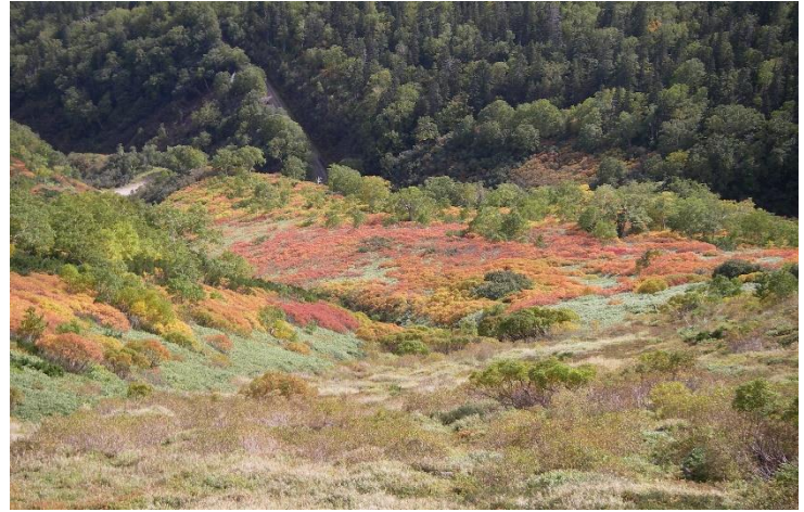
②第一花園下部俯瞰

紅葉の色づき具合は赤岳コース中間から下部にかけて見ごろとなり、特に第1花園から奥の平にかけてのウラジロナナカマド紅葉がずいぶんと拡がりを見せてきました。①②③④