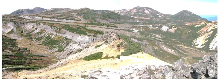
赤岳山頂より北鎮岳～黒岳方面