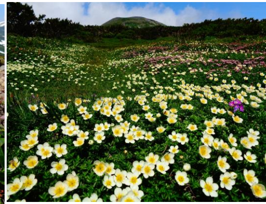
④ポン黒岳周辺～雲ノ平周辺