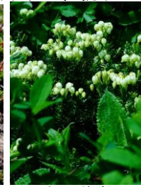
アオノツガザクラ