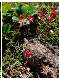
チシマツガザクラ