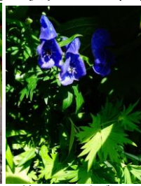
ダイセツトリカブト