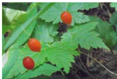
オオバタケシマランの実