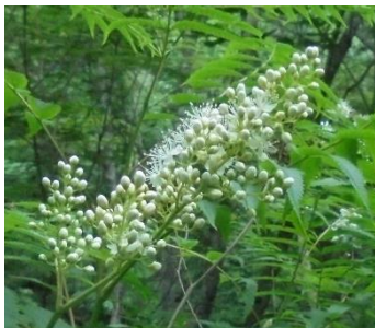
ホザキナナカマド