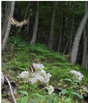
ヨツバヒヨドリと蝶