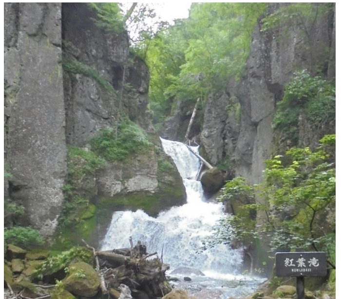
紅葉滝: 飛沫は冷たく涼しい風が吹いています