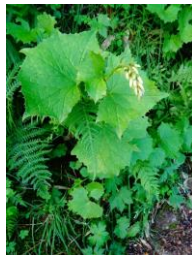
コモチミミコウモリ