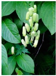
エゾノレイジンソウ