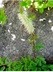
タカネトウチソウ