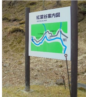
入り口看板付近の様子