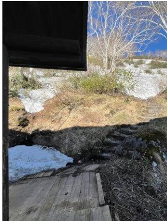
①七合目事務所付近