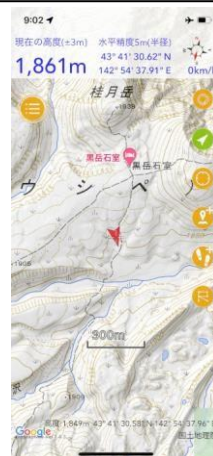
⑦右の写真の撮影個所