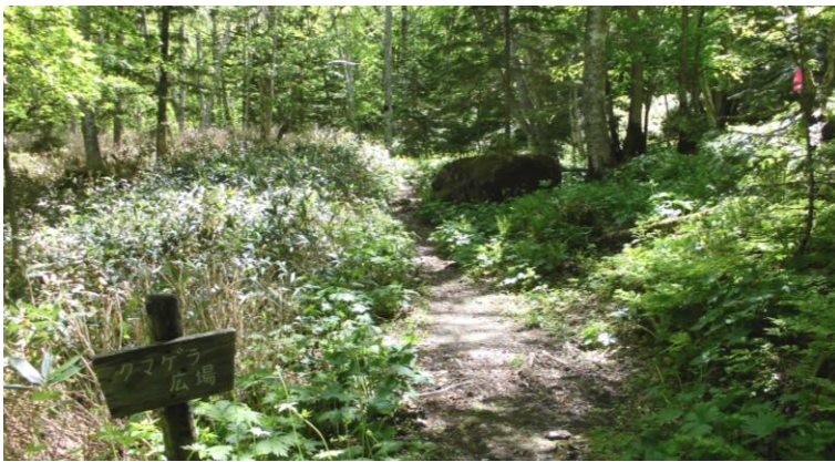
クマゲラ広場の様子です。笹枯れが進んでいます。