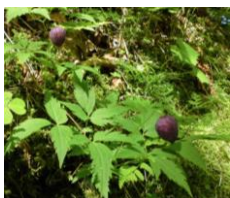
ミヤマハンショウヅル