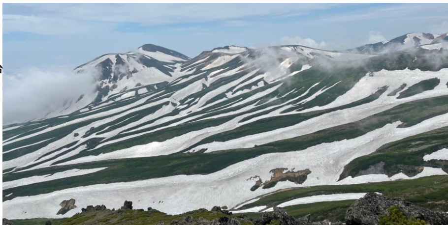
白雲岳山頂から旭岳方面の眺望