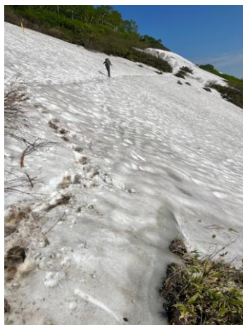
②第一花園看板付近