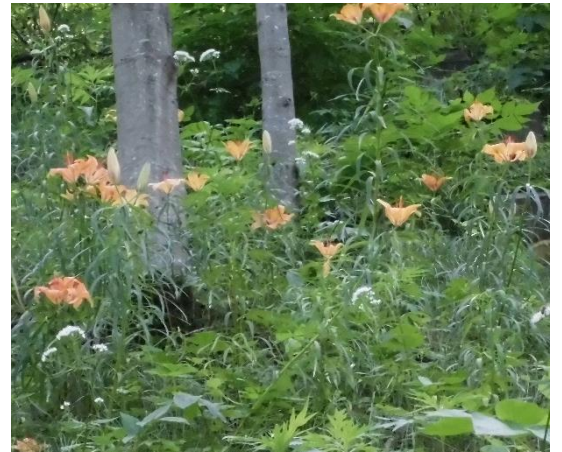
エゾスカシユリ(紅葉谷に向かう道路の法面)