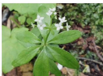
オククルマムグラ