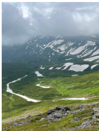
⑥南沢上部から高根が原東斜面