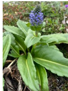
ホソバウルップソウ