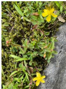
ダイセツヒナオトギリ