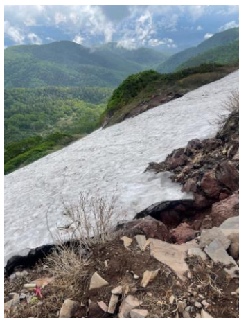
⑤エイコの沢ガレ場