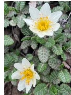
チョウノスケソウ