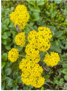
チシマキンレイカ