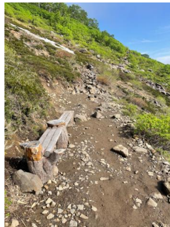
③第一花園看板付近