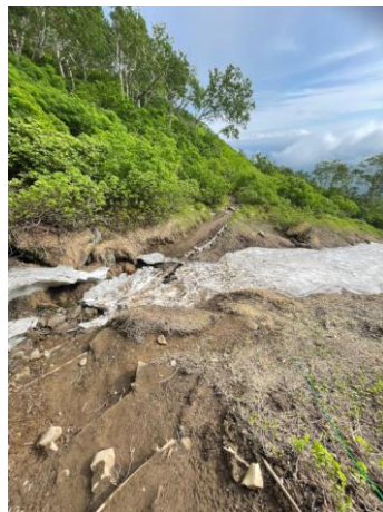
②第一花園下沢地形