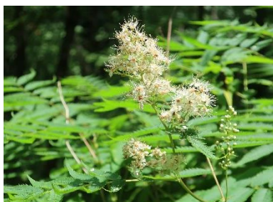
ホザキナナカマド