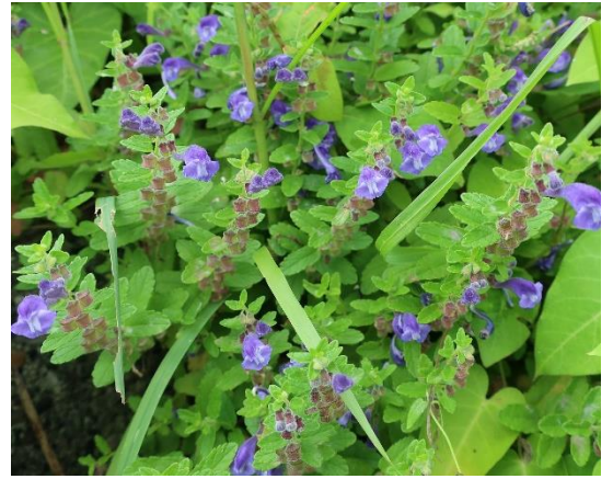
ナミキソウ(紅葉谷・東屋周辺)