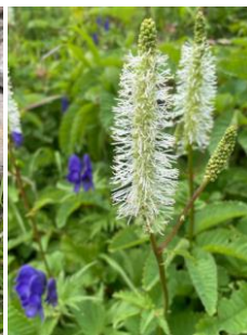
タカネウウチソウ