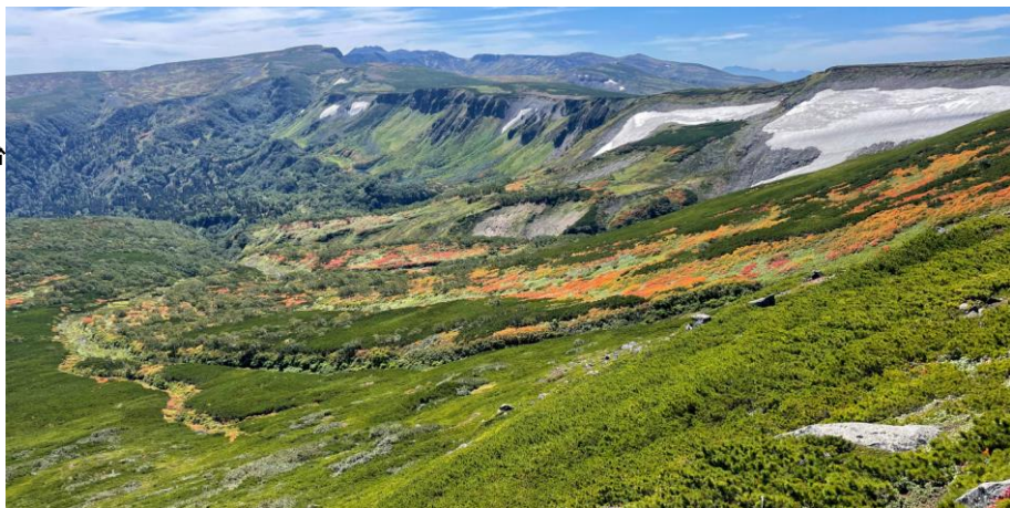
松浦岳(緑岳)南沢の紅葉(通称「タスキの紅葉」)