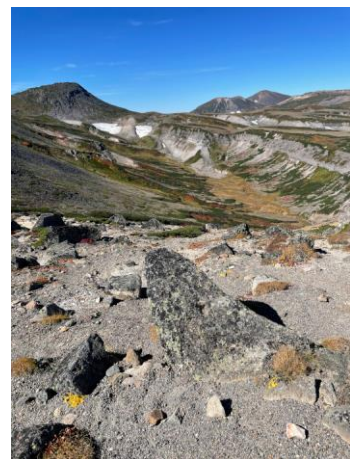
④赤岳山頂から花の沢眺望

赤岳斜面・緑岳斜面ともに全体的に色づきが増し、紅葉は見頃期に入った(①⑥ 上写真)。