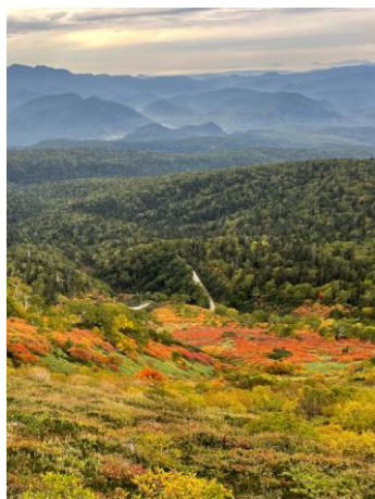
②第一花園看板付近