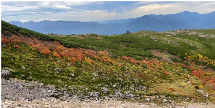
第三雪渓中段から北大雪方面の眺望