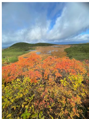
⑤四ノ沼展望地より

風の強い日は体感気温も低下しますので、しっかりとした防寒対策で紅葉狩りを楽しんでください。