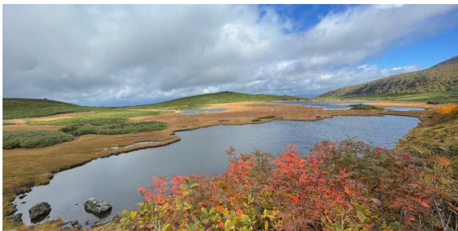
半月沼付近の眺望