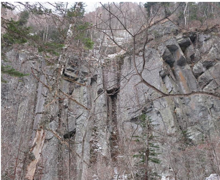
木々の葉が落ち、柱状節理のパノラマを堪能できます。