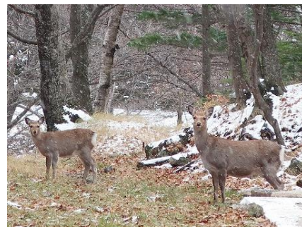
温泉源泉付近にいたエゾシカ