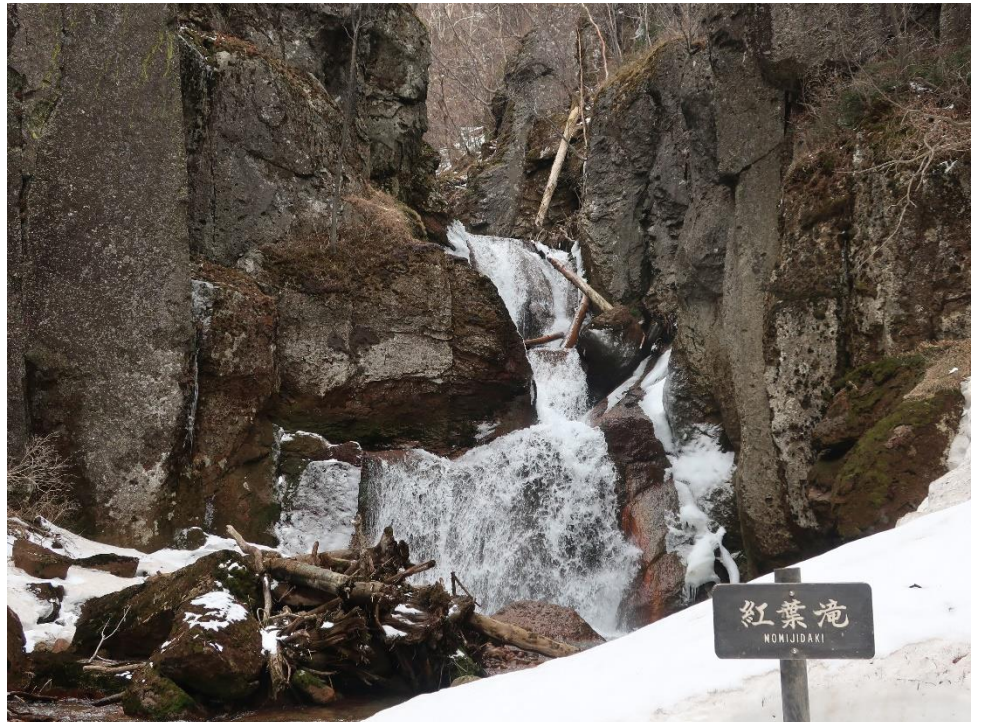
紅葉滝: まだ、端に少し雪が残っていますが、厚く凍っていた氷も解けて、豪快に水が流れています。