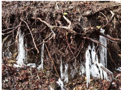
入口看板付近で見られた氷柱