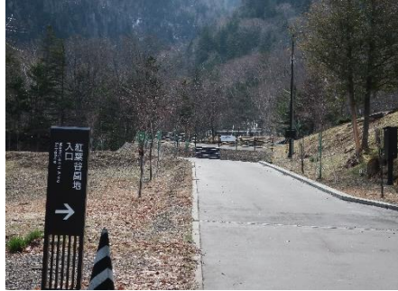
入口看板付近の様子