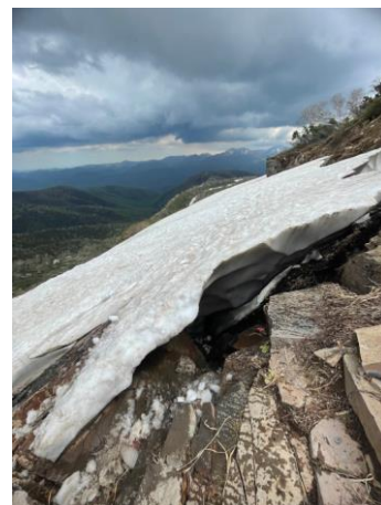
④エイコの沢ガレ場

第一花畑ではすでに木道が一部露出しているが②、それ以外はエイコの沢ガレ場まで雪原状態。ルートをしめすマーカー(赤旗)や虎ロープはまだ設置されていないので①、視界不良時はGPSや地図アプリなどでのルートファインディングが必要になる。