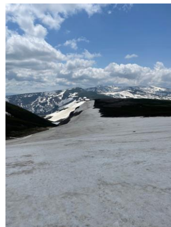
⑧白雲小屋直下(高根ヶ原)