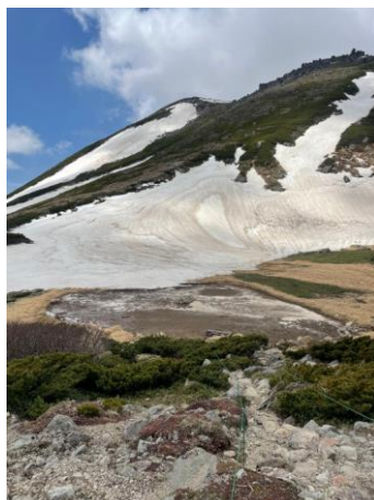
⑦白雲小屋テント場