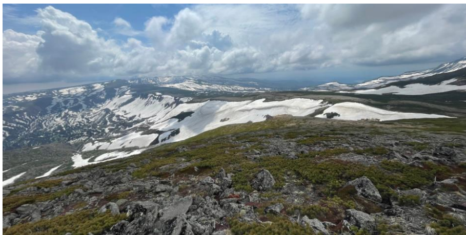
松浦岳(緑岳)山頂より高根が原方面