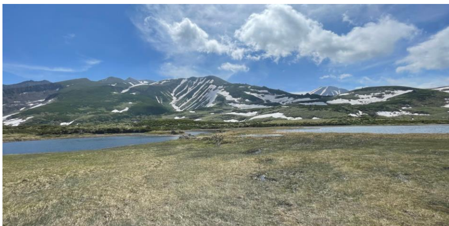
六ノ沼付近から大雪山の眺望