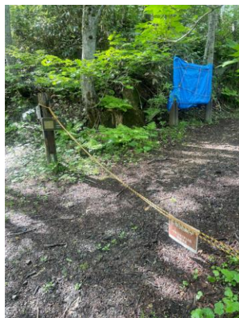
②三十三曲コース入口