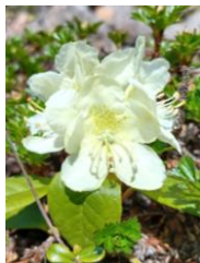
キバナシャクナゲ