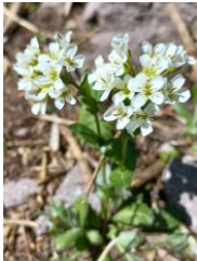
エゾノイワハタザオ

【開花状況】【八合目】エゾノイワハタザオ・ショウジョウバカマ 【九合目】エゾノイワハタザオ・ショウジョウバカマ・ジンヨウキスミレ・キバナノコマノツメ・ミヤマキンポウゲ 【山頂～ポン黒岳】キバナシャクナゲ・メアカンキンバイ・ミネズオウ・イワウメ・コメバツガザクラ・ミヤマキンバイ 【石室～雲ノ平】エゾコザクラ・キバナシャクナゲ・エゾノツガザクラ・ミネズオウ・メアカンキンバイ・ミヤマキンバイ・イワウメ・ヒメクロマメノキ