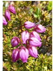
エゾノツガザクラ