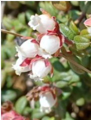
コメバツガザクラ