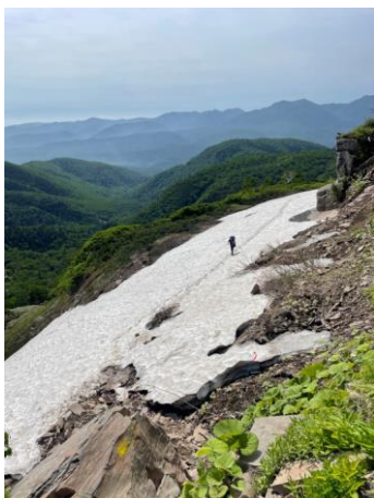
⑤エイコの沢ガレ場

数は少ないが、コマクサ・ミヤマアズマギクも開花が始まり、レブンサイコは蕾のものがほとんど。チシマアマナは開花終了、エゾノハクサンイチゲは開花のピークを過ぎた。