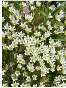
エゾタカネツメクサ