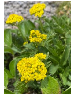
チシマキンレイカ