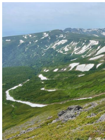
⑥南沢上部より高根が原