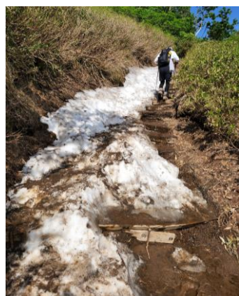
①黒岳八合目登山道-1

【開花状況】【九合目】ホソバイワベンケイ・トカチフクロ始・ウコンウツギ・カラマツソウ・ミヤマキンボウゲ・ハクサンチドリ・ウラジロナナカマド・エゾヒメクワガタ・ジンヨウキスミレ・チシマヒョウタンボク・チシマノキンバイソウ等 【山頂～ガレ場】イワブクロ・イソツツジ始・コケモモ・エゾイワツメクサ・メアカンキンバイ・イワヒゲ・エゾタカネスミレ・コマクサ・エゾノツガザクラ・ヒメイソツツジ等 【石室周辺～雲ノ平】チングルマ・ミヤマキンバイ・キバナシャクナゲ・エゾコザクラ・コエゾツガザクラ・イワヒゲ・ウラジロナナカマド・ヒメクロマメノキ等 【北海沢】エゾコザクラ・エゾノツガザクラ・チングルマ・アオノツガザクラ・ウラジロナナカマド等