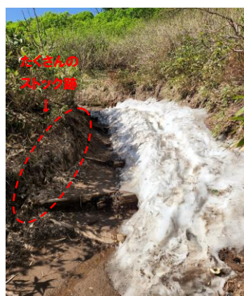
②黒岳八合目登山道-2