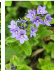
エゾヒメクワガタ