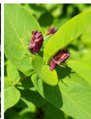
チシマヒョウタンボク