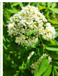
ウラジロナナカマド