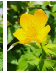
チシマキンバイソウ

【開花状況】【九合目】ホソバイワベンケイ・トカチフクロ始・ウコンウツギ・カラマツソウ・ミヤマキンボウゲ・ハクサンチドリ・ウラジロナナカマド・エゾヒメクワガタ・ジンヨウキスミレ・チシマヒョウタンボク・チシマノキンバイソウ等 【山頂～ガレ場】イワブクロ・イソツツジ始・コケモモ・エゾイワツメクサ・メアカンキンバイ・イワヒゲ・エゾタカネスミレ・コマクサ・エゾノツガザクラ・ヒメイソツツジ等 【石室周辺～雲ノ平】チングルマ・ミヤマキンバイ・キバナシャクナゲ・エゾコザクラ・コエゾツガザクラ・イワヒゲ・ウラジロナナカマド・ヒメクロマメノキ等 【北海沢】エゾコザクラ・エゾノツガザクラ・チングルマ・アオノツガザクラ・ウラジロナナカマド等