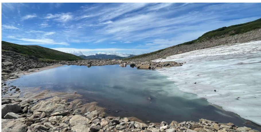
板垣新道底部に出現した水たまり