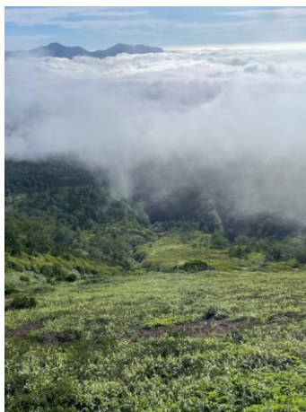
②第一花園より俯瞰