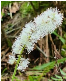
サラシナショウマ