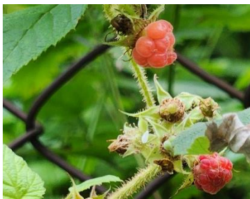
エゾイチゴの実【坂道沿い】