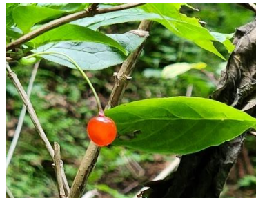
エゾヒヨウタンボクの実