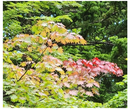
色づき始めているハウチワカエデ