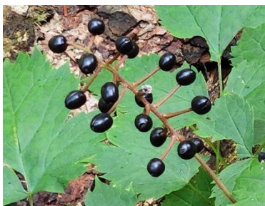
ルイヨウショウマの実