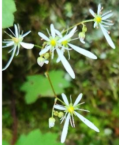
ダイヤモンドソウ