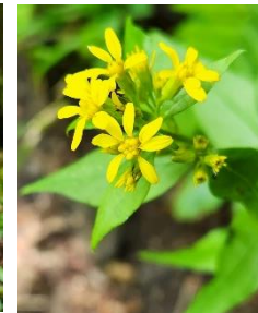
ミヤマアキノキリンソウ