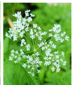
ミヤマセンキュウ