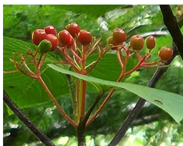
オオカメノキの実